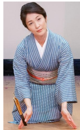
日本舞踊 花柳流(25年)