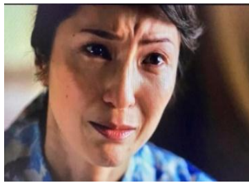
Netflix映画「アースクエイクバード」