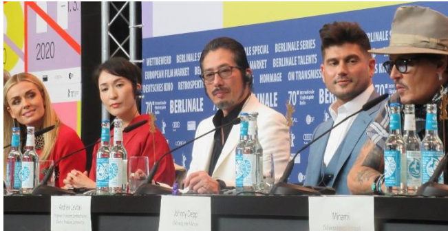
映画「MINAMATA」ベルリン国際映画祭 記者会見&レッドカーペット